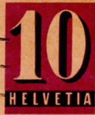
AESCHI BEI SPIEZ

POSTKARTE CARTE POSTALE CARTOLINA POSTALE